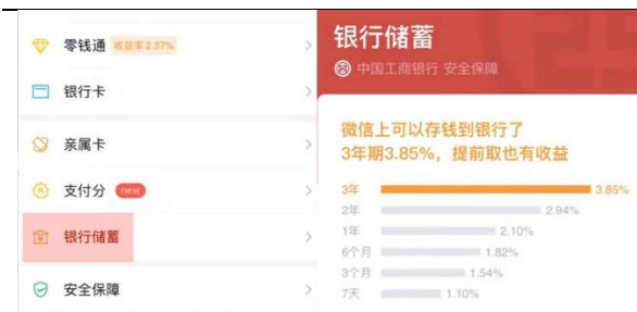
图 1: “银行储蓄”功能出现在微信钱包界面